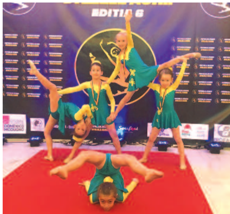
Nóri a magasban

– Nagyon kedvelem az olyan összeállítást, amelyben a hangsúly a ritmikus torna elemein van. Ugyanakkor a művészi kifejezést is fontosnak érzem – mondta elgondolkodva a kisebbik táncos. A következő