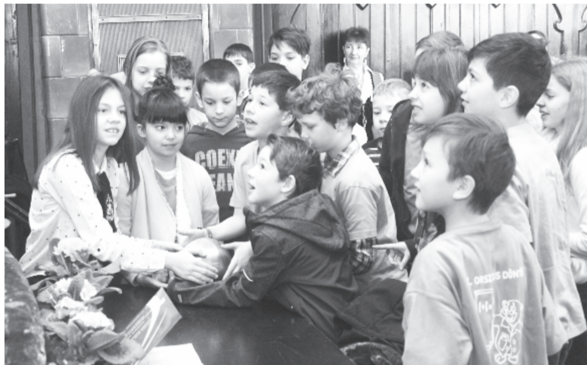
A Gömböccel ismerkedtek a versenyzők