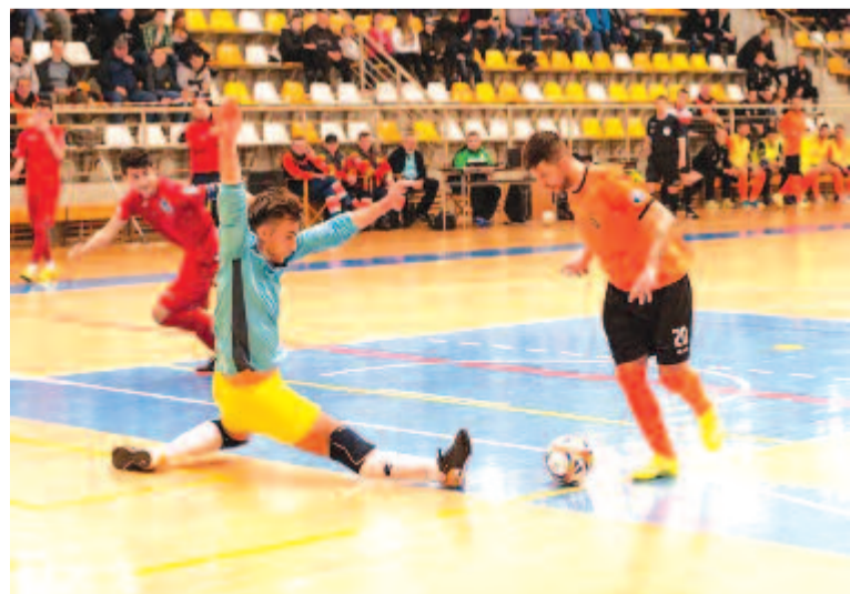
Csak az első 11 percig bírta gól nélkül a fiatal marosvásárhelyi együttes. Az első félidő második felében öt gólt szerzett a csíki csapat.

szövetség, és így játék nélkül veszített a Dévai Autobergamo ellen. A kizárást azonban már nem kockáztatta Kacsó Endre csapata, és elutazott Csíkszeredába, noha alig nyolc játékosal lépett pályára egy tét nélküli mérkőzésen. A csíkszeredaiak különösebb megerőtetés nyerték a